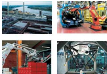
ABB bietet für Industrie und öffentliche Versorger Lösungen zur Leistungsoptimierung, einhergehend mit einer Reduzierung der Umweltbelastungen.

ABB ( www.abb.com ) ist weltweit führend im Bereich Energie- und Automationslösungen und bietet Industrie und öffentlichen Versorgern Lösungen zur Leistungsoptimierung, einhergehend mit einer Reduzierung der Umweltbelastungen. Die ABB-Gruppe ist in ca. 100 Ländern vertreten und beschäftigt ca. 139.000 Mitarbeiter.